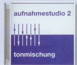
Fahnen Schild flag mounting sign