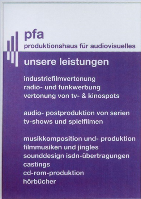
Hauptwegweiser main direction sign