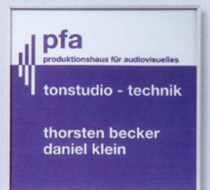
Türschild door sign