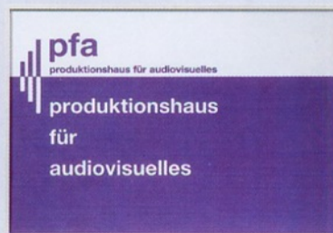
Etagenwegweiser floor direction sign